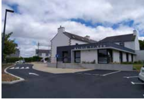
Extension et rénovation

Ce nouveau cadre de vie offre un confort aux agents et élus municipaux mais surtout aux habitants de la commune reçus dans le nouvel espace d'accueil de la mairie.