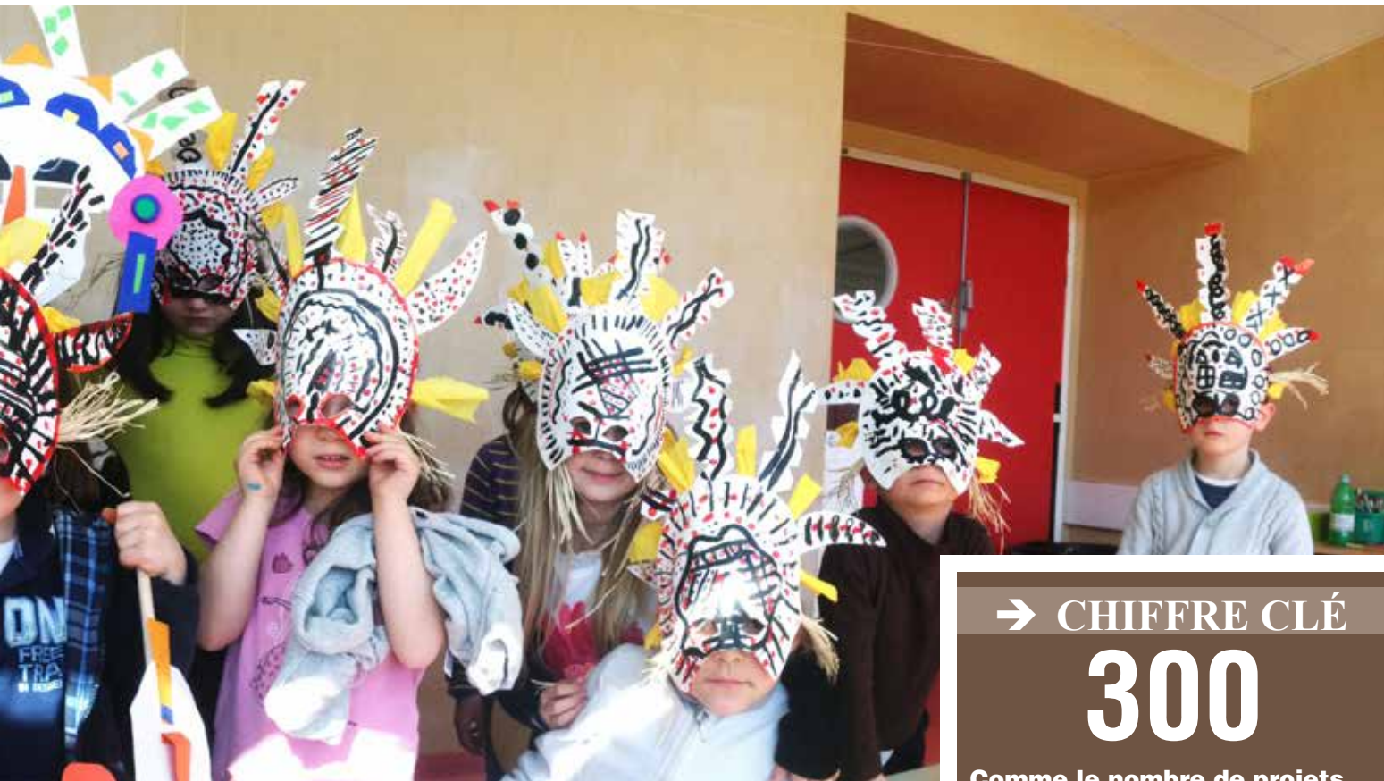
Animation Déclics 2016 - "Masques du Monde"