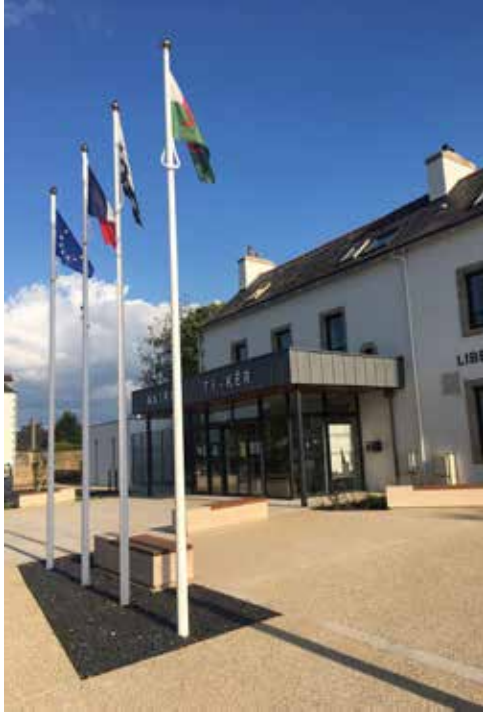
La mairie et son parvis

Suite au retard dû à la crise du Covid-19 et au confinement, le programme de travaux comprenant la rénovation et l'extension de la mairie, la construction d'un bâtiment pour les archives municipales et la réfection du parvis est enfin arrivé à son terme.