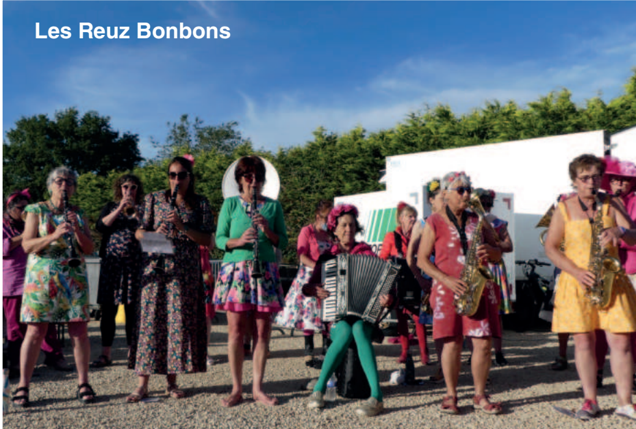
Les Reuz Bonbons

Une belle soirée appréciée de tous et qui a bénéficié d'une météo estivale !