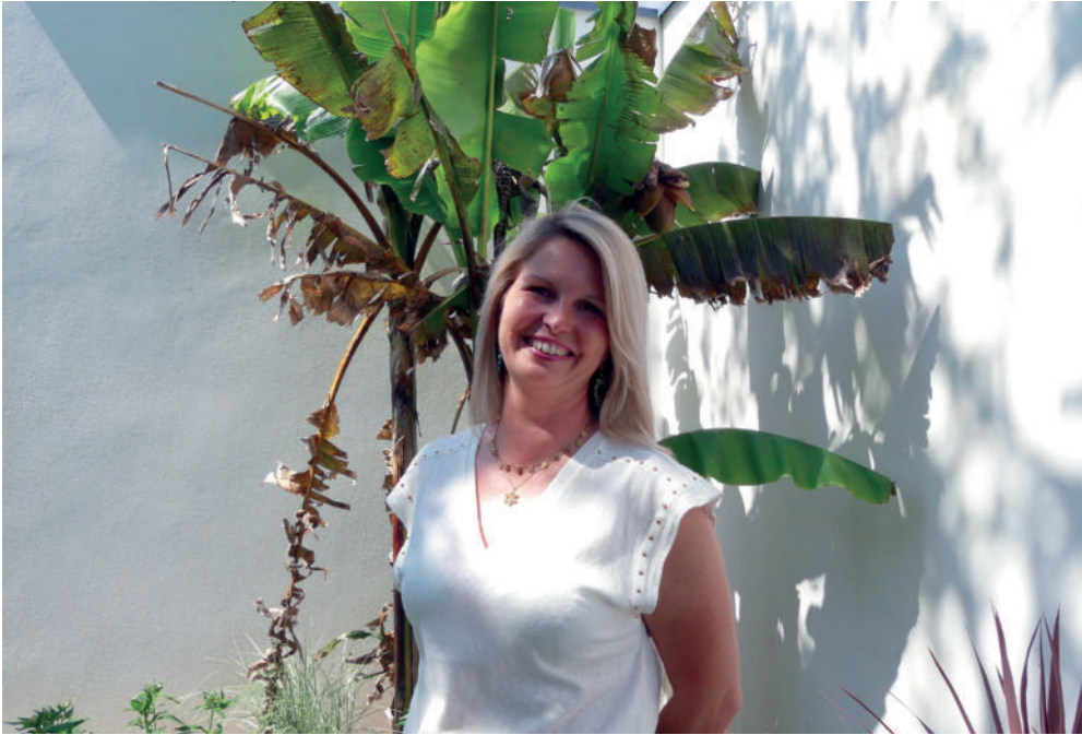
Au miroir de Mélanie - aumiroirdemelanie@gmail.com - 06 87 40 21 70