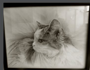
Portrait de la chatte Louloute